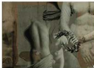
9. Cache-pot, collection Polybase.