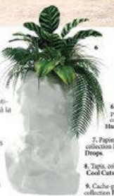
6. Cache-pot, collection Human Being.

Dans un esprit résolument baroque et enjoué, Y02 divertit le quotidien de nos intérieurs en imaginant des collections ludiques et colorées, inspirées de la culture classique, comme la statuaria antique notamment, ou d'un bréviaire quelque peu fantastique. Au menu ? Papiers peints, tapis et cache-pots en fonte, parfois réalisés sur mesure en fonction des vœux de vie. Du dessin à la fabrication des produits, le souci du détail accompagne chaque étape de la conception, associant toujours créativité et technologie.