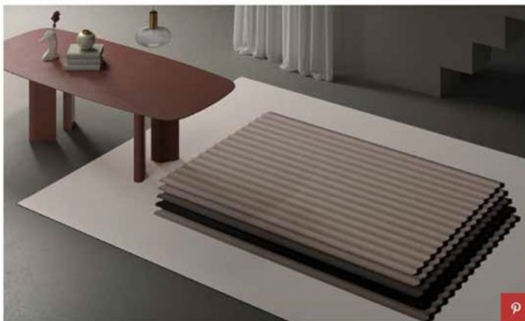
Tappeto Stacked Up di Alain Gilles