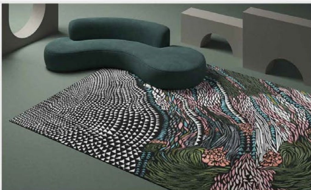
Tapis Wild Vibrations