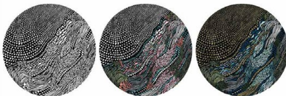
Wild Vibrations Col 01 330 cm