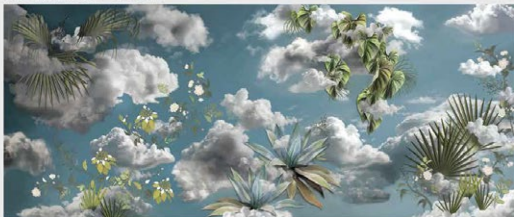
Papier peint panoramique Heaven Green

HEAVEN GREEN , « grand panorama, se déroulant sur un papier peint de plus de six mètres de long, qui associe l'Olympe à la luxuriance d'une Amazonie fantasmée, propice à la rêverie, ce dessin se développe ensuite sur deux tapis moelleux aux formes libres évoquant, cette fois de façon plus candide, les nuages qui courent sur le dessin qu'ils illustrent » ou encore