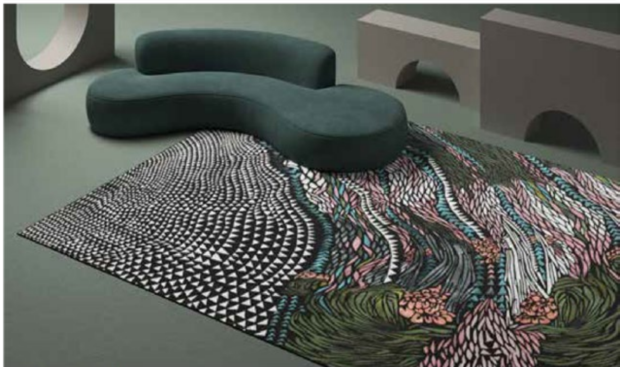
Wild Vibrations Rug

"For this debut collection with YO2 , I imagined two very different, yet similarly dreamlike decors to dress imaginative, dreamy interiors," Sacha Walckhoff .