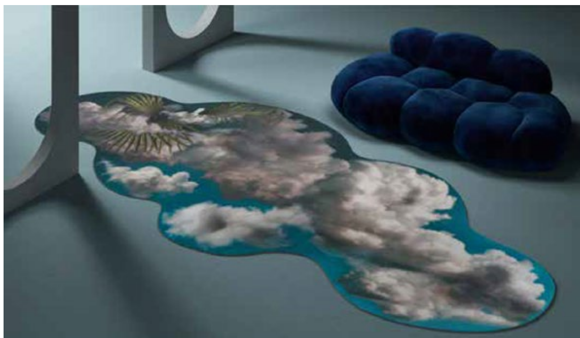
Heaven Green Rug